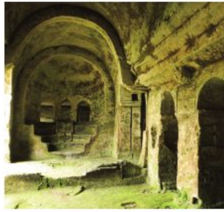
Aya Nikola Manastırı zamana dirense de belediyeden biraz daha fazla ilgi bekliyor.